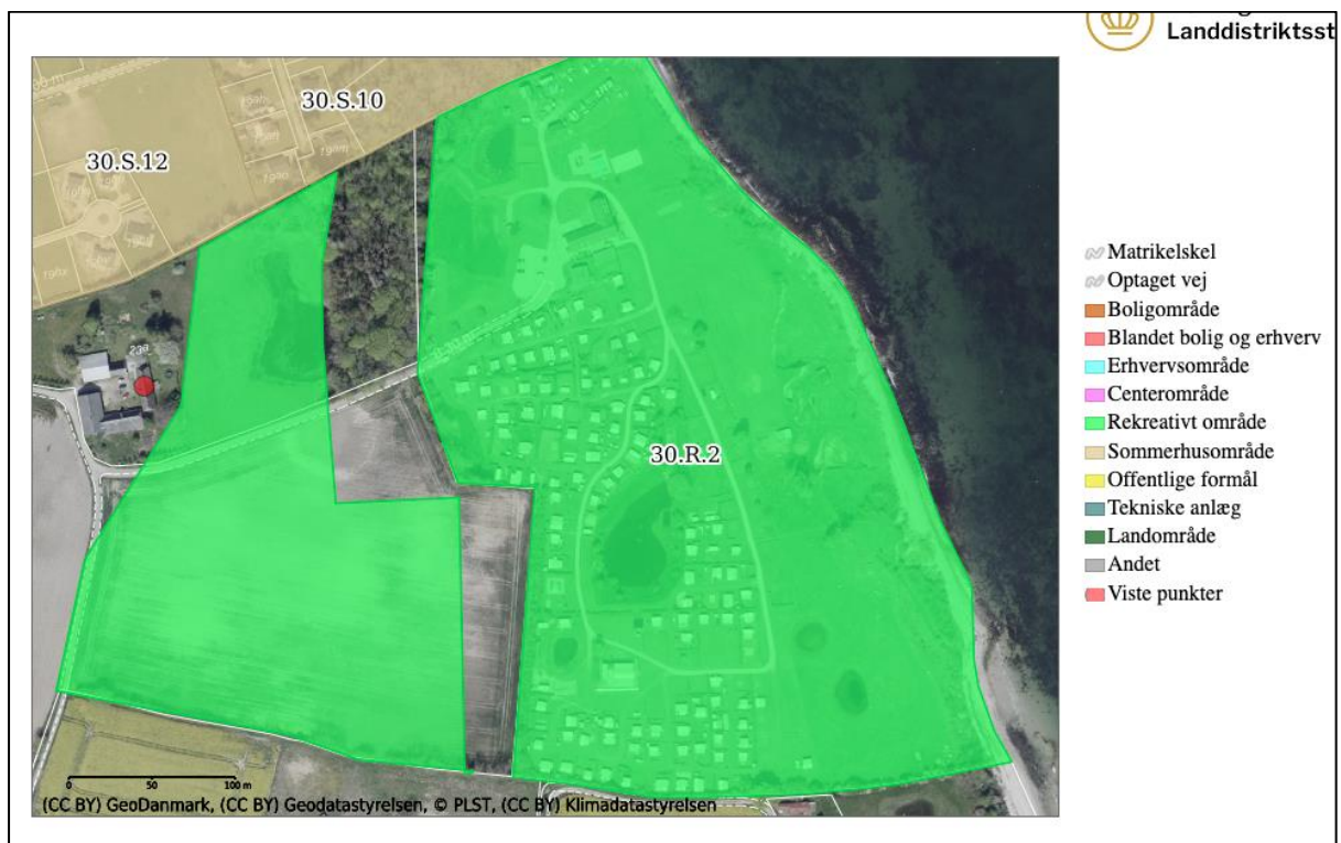
Billede 3: viser hvordan rammeområdet er delt i 2